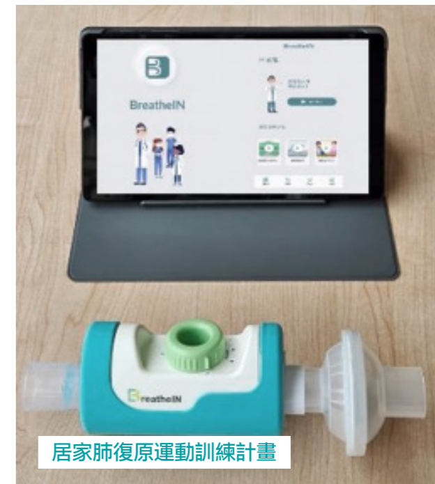
居家肺復原運動訓練計畫

導入居家肺復原運動訓練計畫：教學影片結合呼吸導引 APP，幫助患者在家中進行有效的肺功能訓練，還大幅減少了往返醫院的碳排放，同時也針對適合的肺部手術個案，術前給予肺復原訓練，以增加術後恢復狀況。未來更期待能透過「居家互動式肺復原照護模式系統」，包含「BuddyRT 呼吸訓練器」以及「隨身型肺復原裝置系統」，以感測器紀錄結合 AI 診斷，目前已取得台灣、美國兩地專利，並獲得國家新創獎之鼓勵，可加速落實醫療數位轉型。