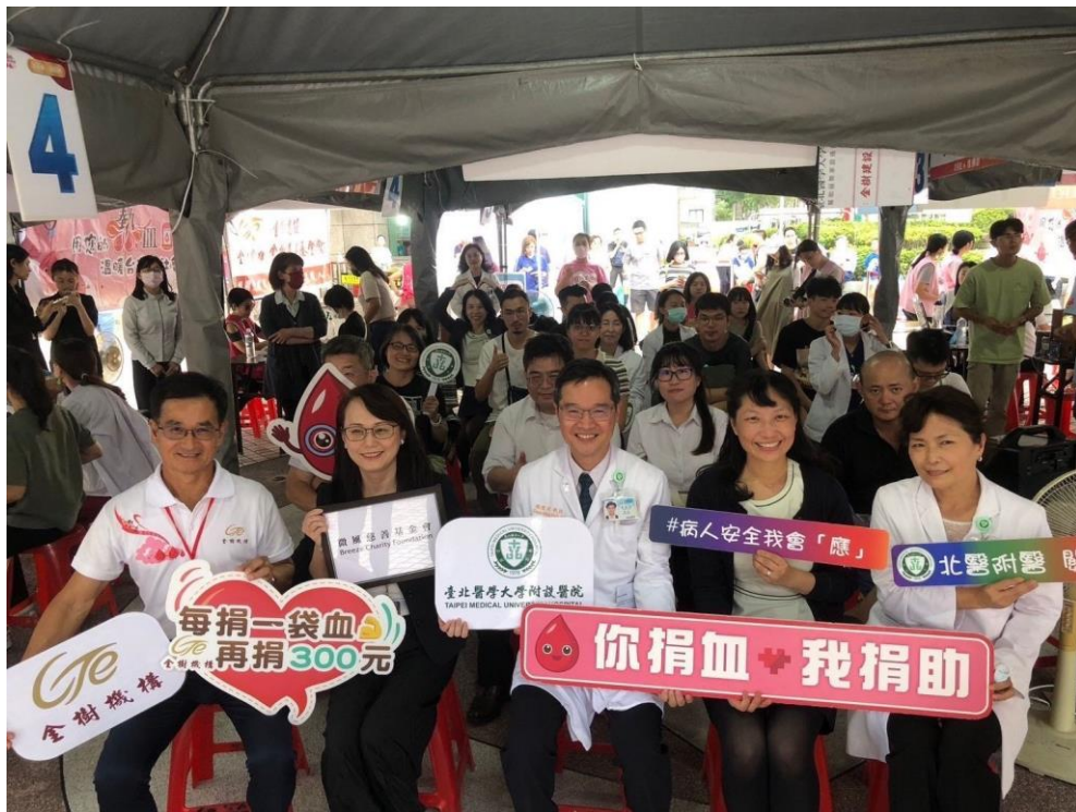
金樹慈善基金會與微風慈善基金會響應此次捐血活動，推出的「您捐血，我捐助」計畫，捐款北醫附醫「機器人輔助復健治療-經濟困難家庭」基金。