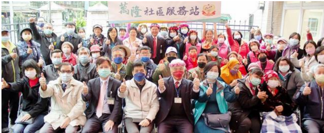
圖)，表示將延續石頭湯精神照護長者】