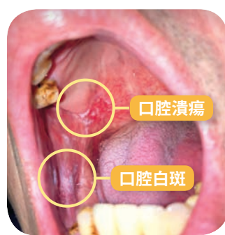
(口腔病變之圖示，非本文所述之案例)

嚼檳榔時，檳榔的粗纖維會不斷地磨損口腔黏膜，使口腔黏膜受傷，傷口不斷摩擦導致結疤不斷累積，造成口腔黏膜纖維化，這就是為什麼長期嚼檳榔的人會張不開嘴巴的原因。此外，檳榔子本身是第一類致癌物，亦即檳榔子即使不加添加物，也會致癌。為了增加口感，業者會加入葉子(荖葉)、菁仔(荖花)、紅灰/白灰等添加物，這些添加物都會造成細胞的變異，進而演變為口腔癌。