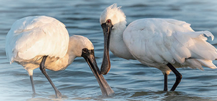
● 圖片來源：攝影師 郭勤