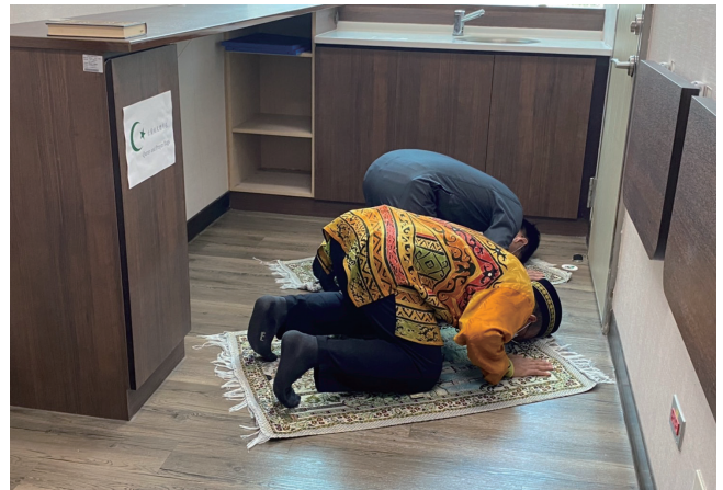
第三醫療大樓2樓設置穆斯林祈禱室，並備有禮拜毯、聖地麥加朝拜方向標示與禮拜時間表，提供信奉伊斯蘭教民眾心靈慰藉空間。

為此，北醫附醫邱仲峯院長指出，院內於今年啟動穆斯林友善計畫，由軟硬體設施著手，並重新設計動線指標，包括於第三醫療大樓二樓設置穆斯林祈禱室及友善廁所，祈禱室內透過屏風規畫男女教友的禮拜空間，並備有禮拜毯、聖地麥加朝拜方向標示與禮拜時間表，提供信奉伊斯蘭教民眾心靈慰藉空間，而祈禱室旁的廁所也設置禮拜前的淨下設施，提供穆斯林使用。