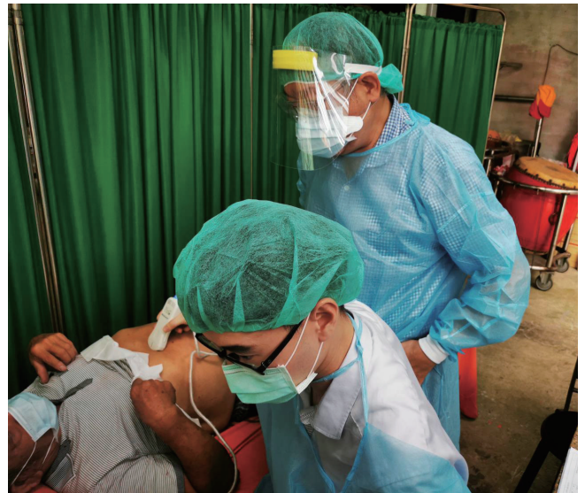
社區居民接受超音波檢查

今年度更與石碇區華梵大學合作帶動教職員健康自主觀念，配合醫療服務據點，進行一系列健康檢測及預防保健觀念，也提供華梵大學師生一個醫療中繼服務站，進而提升石碇區健康意識。今年由華梵大學林從一校長大力推廣北醫附醫醫療服務站，本院將與華梵大學合作臨場服務，將醫院醫療專業帶入校園，冀望能推廣跨領域合作，促進校院及跨學術單位之醫療領域提升及健康促進。