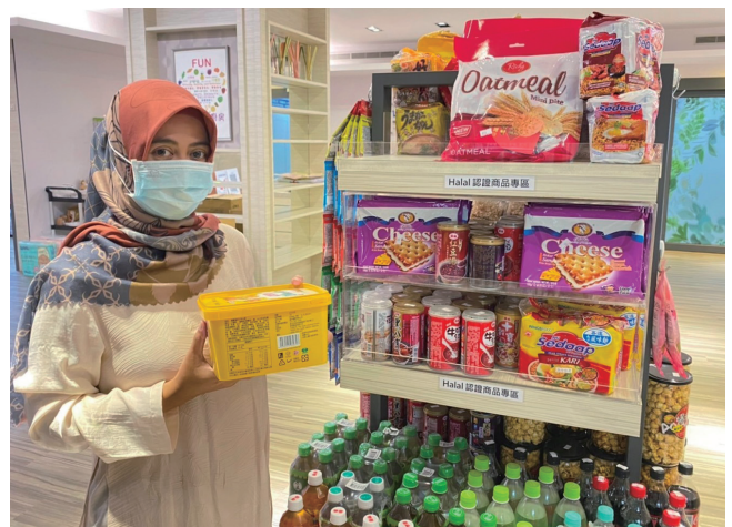
第一醫療大樓B1「Fun心廚房」設有「清真認證商品專區」，專區內的食品皆獲得清真標章。

餐飲方面，院內廚房建置穆斯林專屬烹調區，使用獨立鍋具及餐具，不與一般葷素食者共鍋，調味料及食材皆選用符合清真認證之產品。另外，第一醫療大樓 B1「Fun 心廚房」設有「清真認證商品專區」，專區內的食品皆獲得清真標章，提供穆斯林病人及家屬更多清真飲食的選擇。