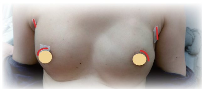
病患接受雙側內視鏡全切除及立即性重建手術，紅線為手術疤痕。