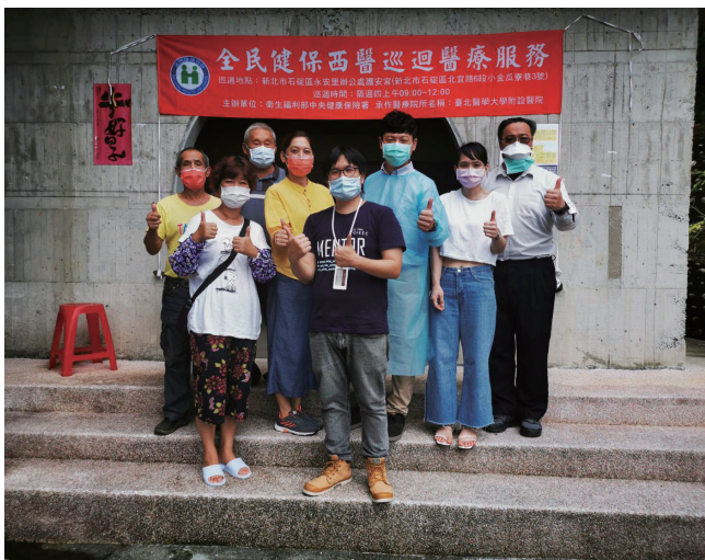
北醫附醫社區醫療巡迴服務