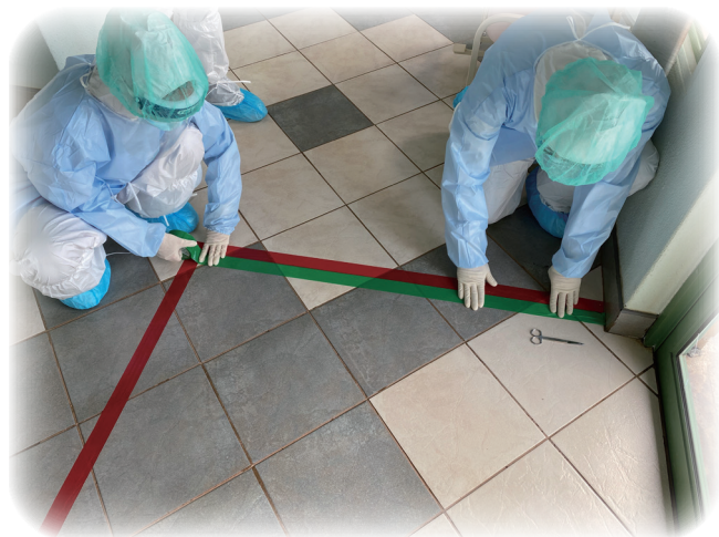
防疫團成員們協助規劃病房的動線

有醫護人員感染。鑒於此，成員們分別針對王室診所的動線規劃、醫護人員個人防護裝備之穿脫、手部衛生、清潔人員的清潔消毒等，引進紫消燈、零接觸生理監視儀、製氧機等新型硬體，加強王室診所面對各種新興傳染病的應變能力。然而，上述規劃僅為第一線之緊急加強，其他長期規劃，包含負壓病房及氧氣槽地建立，則委由我國駐史大使館接手後續開工事宜。