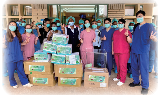
我國捐贈物資運抵史國專門醫院