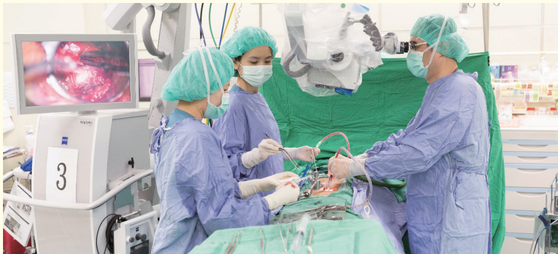
腰椎微創融合手術除了可以減少術後疼痛、快速復原外，更能減少術後病發症及提升病患安全。

目前此手術已相當成熟，從民國 100 年發展以來，已經近 4000 位病患接受此手術。術後的傷口感染機率在術後三十天內為 0.2%，手術中輸血的機率為 2.4%，其它包括三十天內再入院的機率、無預期再入院的機率、手術後三十天內無預期再手術的機率都比國內或國際同儕顯著地低。因此，腰椎微創融合手術除了可以減少術後疼痛、快速復原外，更能達到減少術後病發症及提升病患安全的目的。