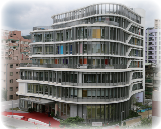
以微笑曲線為設計理念、耗資7.5億元打造的臺北癌症中心大樓，將於今年開始收治病患。

在建築方面，臺北癌症中心讓人眼睛為之一亮。但更特別的是，臺北癌症中心設立了全臺第一家兒童癌症中心，以及國內首創的「領航護理師」。