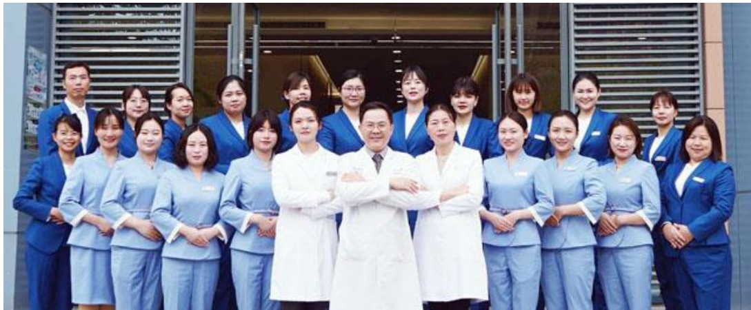
（文/台醫精準健康管理中心）

隨著經濟能力的提升，大陸高端體檢是一種趨勢，臺灣的醫療水準與品質備受民眾讚賞。北醫秉持優質醫療輸出，在大陸實現臺灣味的健管服務，帶入健康可以重建、健康從生活養成等概念，豎立國際化、高端化、客制化、精準化、智慧化的健康管理典範。【下圖：台醫中心組建的健康管理團隊】