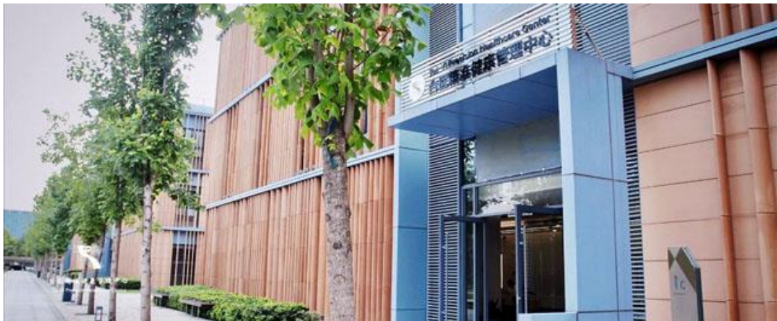
【上圖：台醫精準健康管理中心】

北醫大醫療體系繼受託經營寧波市李惠利東部醫院之後，由集智醫管與萬芳醫院承接南京市江北新區國際健康城最高端的健康管理中心「台醫精準健康管理中心」。本中心由江北新區全資，委託北醫打造及運營管理，冀借北醫體系優質醫療結合人文元素，及萬芳健康管理中心國際先進的健康管理概念，期待在南京也有「品質為先、賓客為尊」的健管服務精神。