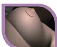
移除水球 縫合傷口