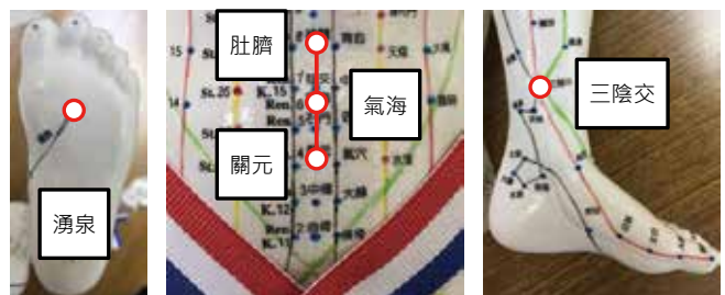
穴道按摩穴位示意圖

以上為中醫對良性攝護腺肥大的小提醒，若有上述症狀出現，請至傳統醫學科就診獲取更多專業的協助。