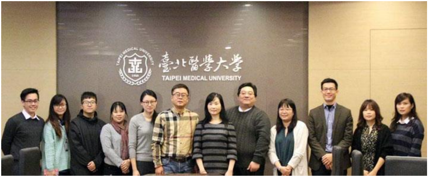
【學三校出席人員合影】