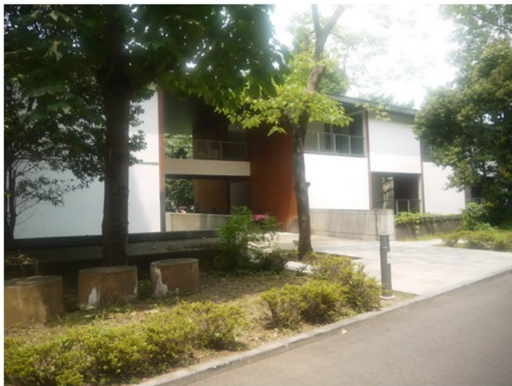
東大農學部國際 學者宿舍與學生 餐廳外觀