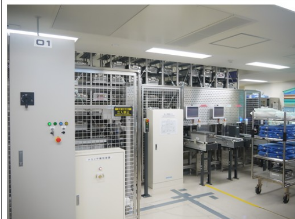
機器人手臂無菌器械運送系統