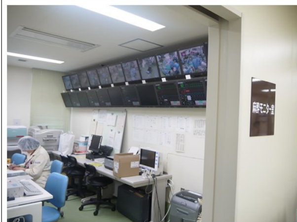
OR 內麻醉科全程以電視牆監控 每間開刀房手術過程