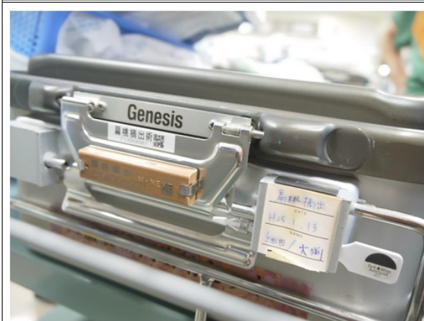
每個器械盒標示手術名稱並以barcode 作管控