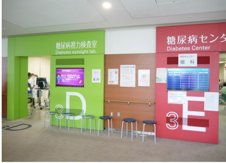
室以顏色作為區隔