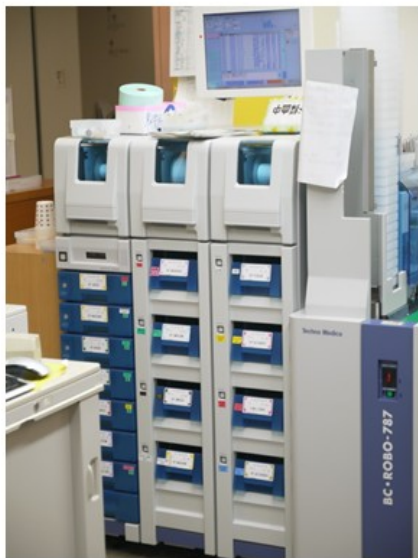
7,000 萬日幣自動標籤抽血試管之儀器