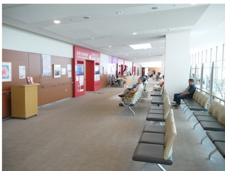
東京女子醫科大學附屬醫院舒適候診空間