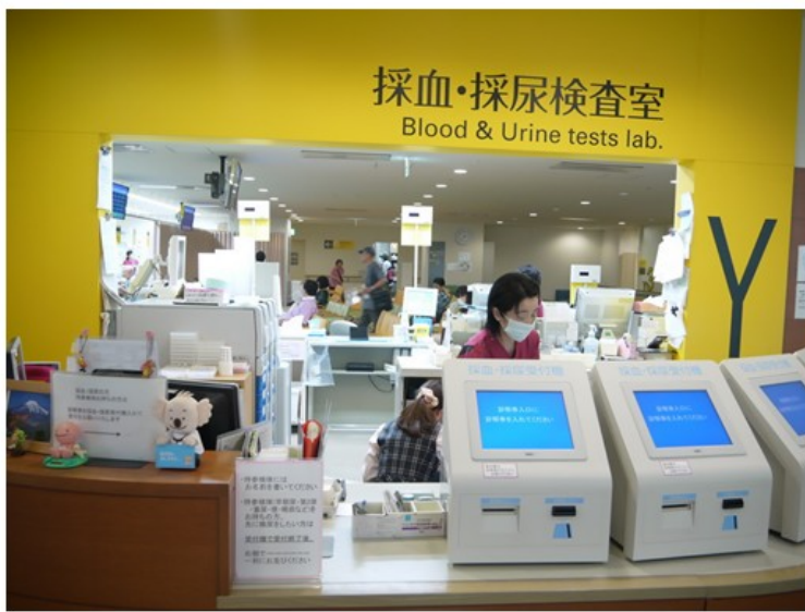
抽血及採尿検査室