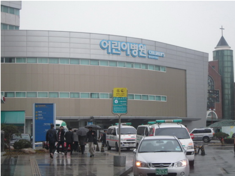
首爾大學兒童醫院