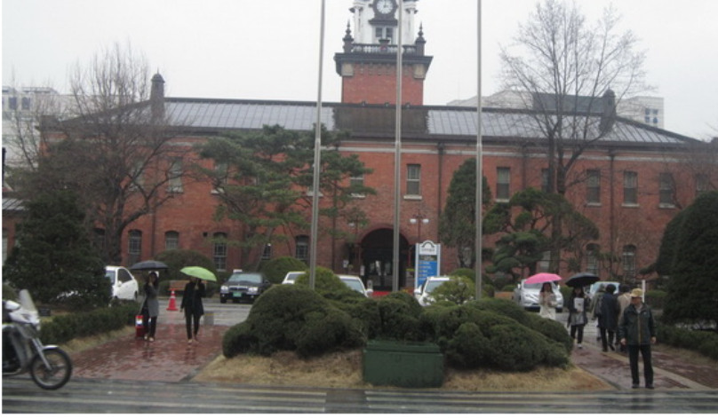
SNU博物館，保存學校相關歷史文物