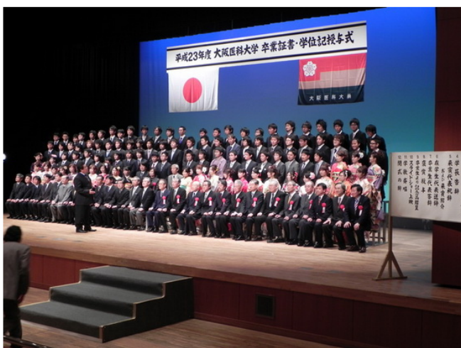
大阪醫科大學畢業典禮