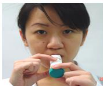
4. 將吸嘴含於兩唇間，快速深深的吸一口氣。