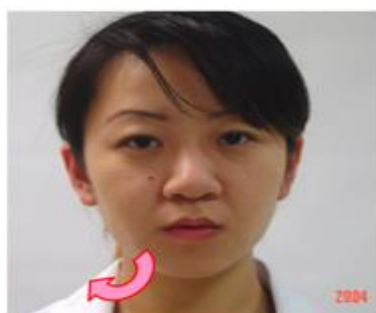
3. 吸入前先呼一口氣