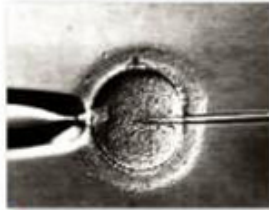
若精子品質不理想時，須以顯微注射來協助受精。

試管嬰兒是指將卵子與精子取出後，在培養皿中使其受精，並發育成胚胎後，再植回母體子宮內。在體外培養的時