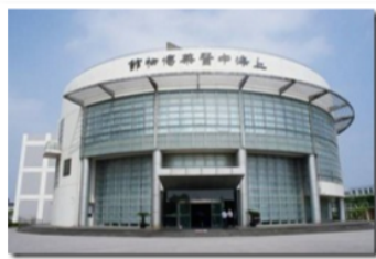
中醫藥博物館建築

中醫藥博物館陳列許多中醫藥相關資料、文物、器具、中草藥與書籍等，對於中醫藥之認識有很大幫助，也有很具體的認識。此外，館內有一互動專區陳設相關互動設備，例如互動式人體穴道認識、脈搏種類實例認識、針灸深度測試...等互動學習裝置，很適合對於中醫藥領域有興趣之同學到館參觀。