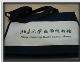
北京大學醫學圖書館袋子