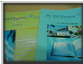
北京大學醫學圖書館館刊