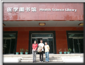
最後離去時，於圖書館門口留念