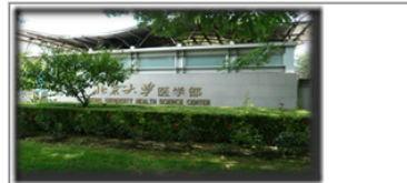
北京大學醫學部西門

此次拜訪北京，有個重要任務，就是與北京大學醫學圖書館交流，雖然臺北醫學大學圖書館已於2011年8月建立姊妹館關係，但可能很多同學並不知道其實北京大學醫學圖書館僅與臺灣的兩間醫學大學締結姊妹館，除了臺灣大學醫學院圖書館外，另一間就是臺北醫學大學圖書館!!!對此我很高興能親自探訪這間鮮爲人知的海外姊妹館!!!依地圖上的指示，沿著大馬路上的學院路，一會兒北京大學醫學館的字樣就出現在右手邊了，由於這是我第一次拜訪中國的大學，心想不知會不會與臺灣有很大的差別?不過安全的通過門口公安檢查後，頓時鬆一口氣，還好只是單純的訪客登記，沒有受到太多的阻礙，一進入後，抬頭即看到『北京大學醫學部』的大字印入眼前。