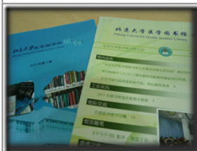
北京大學醫學圖書館館刊