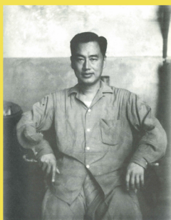
臺灣另類牧師·醫師 謝緯 (臺灣南投)