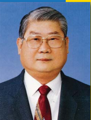
現代史懷哲——謝獻臣教授