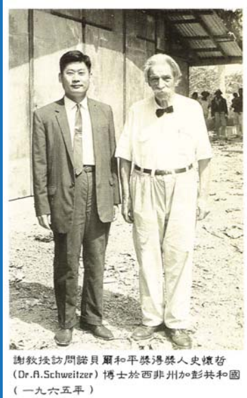
謝教授訪問諾貝爾和平獎得獎人史懷哲(Dr.A.Schweitzer)博士於西非州加彭共和國(一九六五年)