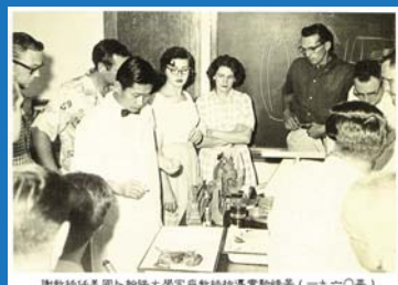
謝教授與美國卜賴隆大學客座教授指導實驗結果(一九六〇年)