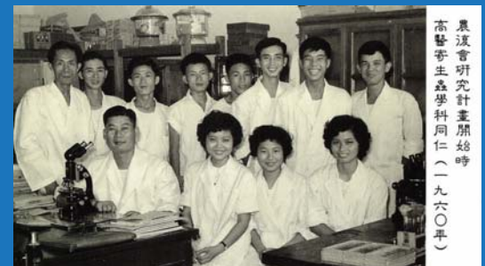
農溪音研究計畫開始時高醫寄生蟲學科同仁（一九六〇年）