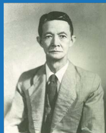
杜聰明不僅是台灣蛇毒研究的奠基者，同時也是台灣藥理學之父；他個人最大的學術成就在於鴉片除癮研究，其中又以一九三一年他所發明的尿液檢驗法最為世人稱道，直到現在，依然是抽驗服用毒品、禁藥者最便捷的方法。