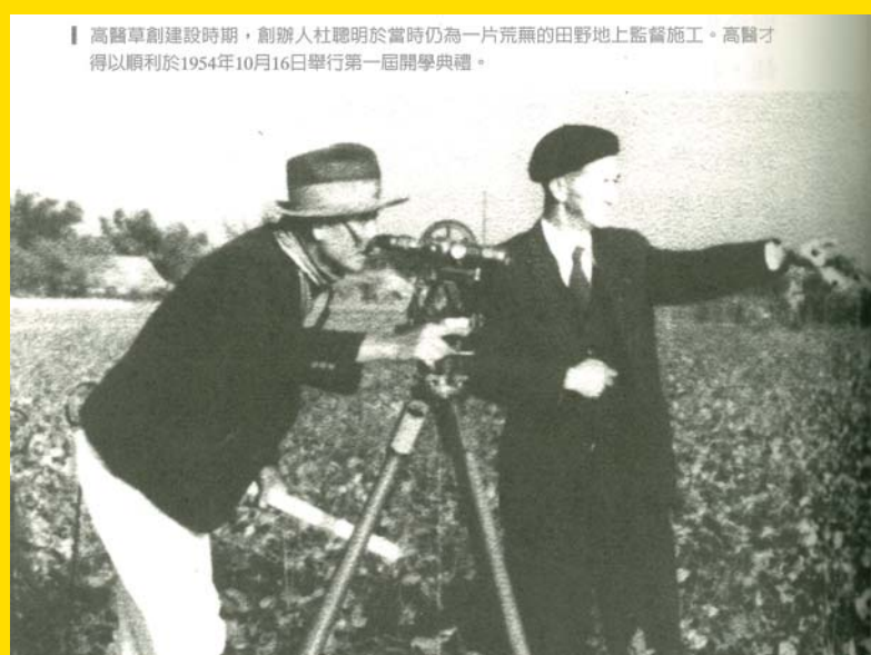
高醫草創建設時期，創辦人杜聰明於當時仍為一片荒蕪的田野地上監督施工。高醫才得以順利於1954年10月16日舉行第一屆開學典禮。

http://www2.kmu.edu.tw/front/bin/ptlist.phtml?Category=112