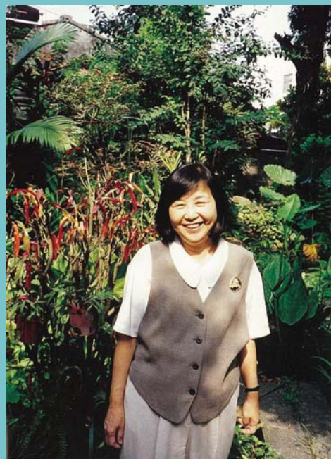
臺灣血液之母-林媽利 (臺灣臺南)