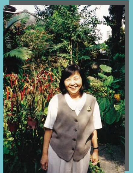
風中的波斯菊一書