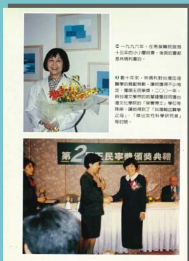
風中的波斯菊一書二