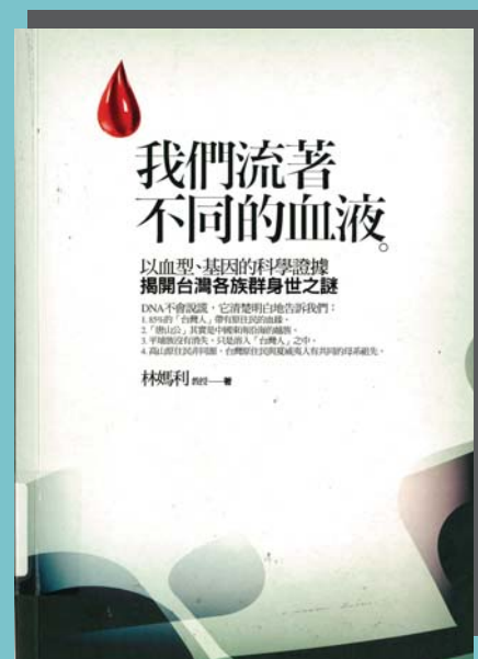
我們流著不同的血液封面