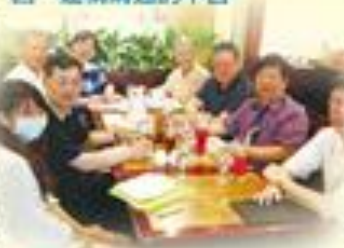
▶ 醫友會編輯會議，林理事長列席參與

醫學系的發展，有賴董事會、校長、醫學院與醫院院長、醫師與校友的共同努力，不論是內部或是外部資源，醫友會將積極建構溝通與集結能量的平台，提供醫學系發展的支持，均可以透過醫友會平台溝通、協調與推動，不論是離開學校很久的資深醫友、醫院或開業校友，或是在北醫大校院任職的醫友、醫學生，都可以把意見或想法提供給醫友會，醫友會會盡力協助溝通與協調，未來會刊上也將新闢專欄供大家發聲。