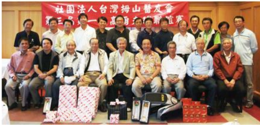
第一次高爾夫球聯誼賽留影 台灣拇山醫友會第三屆

心情與欣賞球場美景;球賽進行中,不乏出現許多的掌聲與惋惜聲,更不時傳來歡笑與喝采的聲音,在不知不覺中,日色漸暮,十八洞的比賽已入尾聲,帶著些許疲累的雙腳,在淋浴過後,十分舒暢,爾後眾人陸續回到餐廳,在廠商協辦的品酒會中,再度與老友們歡樂閒聊,也難得能見到眾名醫們能放下繁忙的工作而愉悅的交流。