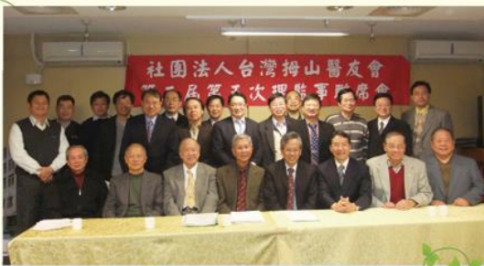
第三屆第五次理監事聯席會