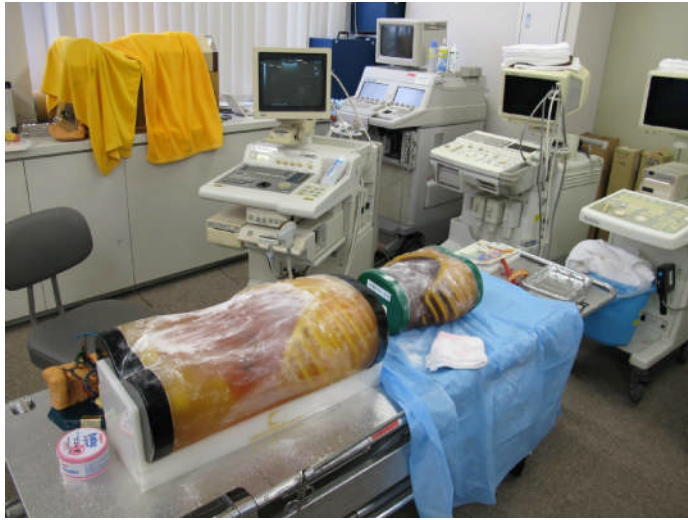
圖 9 超音波使用的假體

最後下午前往大阪醫科大學，該校由內科花房俊昭主任、國際交流部河野公一部長親自接待，並陪同參訪教室、具有代表性的校史館、藏書豐富的圖書館與閱讀室，值得一提的是展覽館展出的古書，還有教學的模擬設備，包括模擬胃鏡，相當先進，隨後到病房和健檢區，更是大該眼見。過程中該特別關照北醫學生的生活，向我們介紹餐廳和平日提供給北醫學生的早午餐，對北醫學生相當優惠。