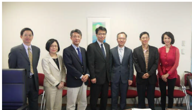
圖 1 洽談會後合照

名古屋大學為世界知名大學之一，醫學系研究科佔14.4%為外國學生，十分重視國際交流。目前仍在努力與該校洽談醫學生交換見實習細節中。