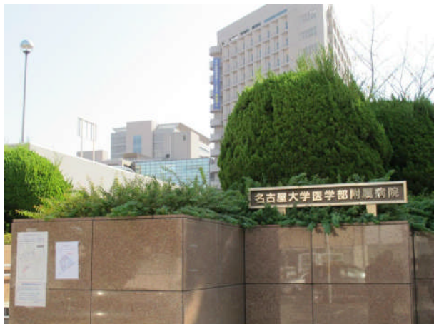
圖 3 名古屋大學附屬醫院外貌