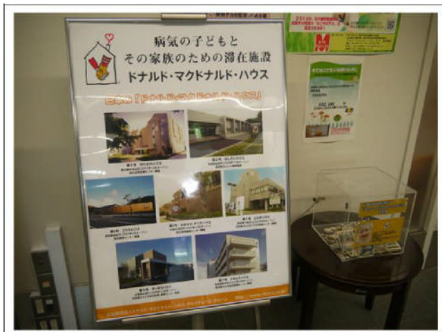
名古屋大學附屬病 院與麥當勞共同合 作募款籌建『鶴舞 麥當勞叔叔之家』