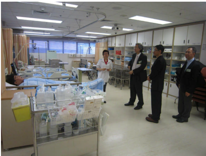
本校代表團參觀香港理工大學護理實驗室