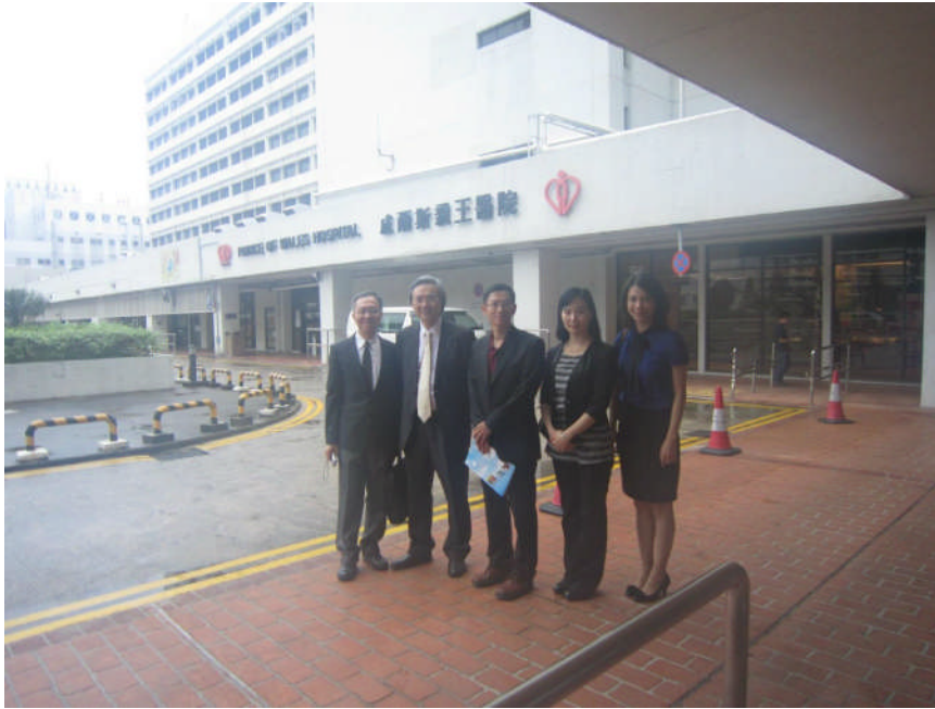
本校代表團於 Prince of Wales Hospital 前合照