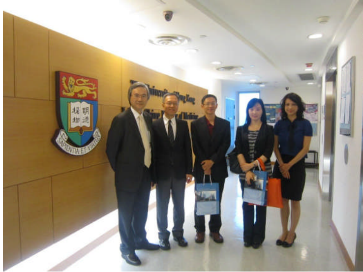
北醫代表團於香港大學李嘉誠醫學院大廳合照