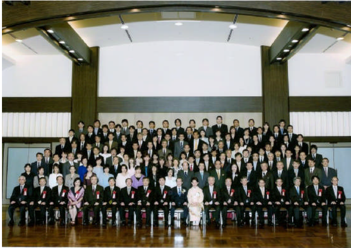
武谷雄二教授退任記念式典・祝賀会 平成24年4月21日 於：ホテルオークラ東京 第2組（全3組）：御来賓、東京大学医学部産科婦人科学教室同窓会員（昭和57年卒～平成11年卒）