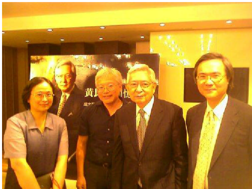
黃崑巖教授身影(一)