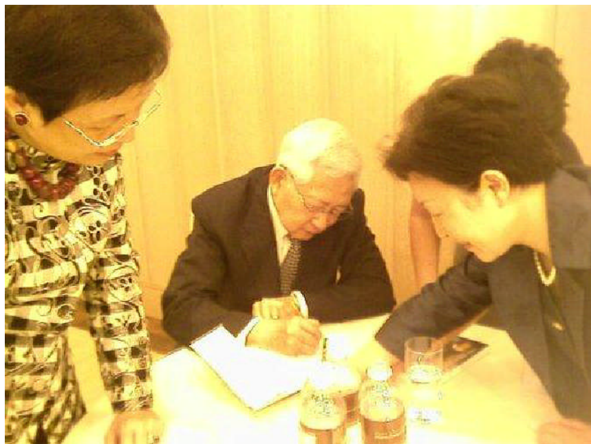
黃崑巖教授身影(二)