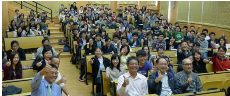
【圖：徐醫師以說故事方式演講，樂觀進取的生命熱力感染了所有的與會者】