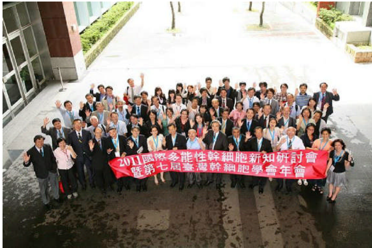
圖二，全體與會講員及座長大合照。