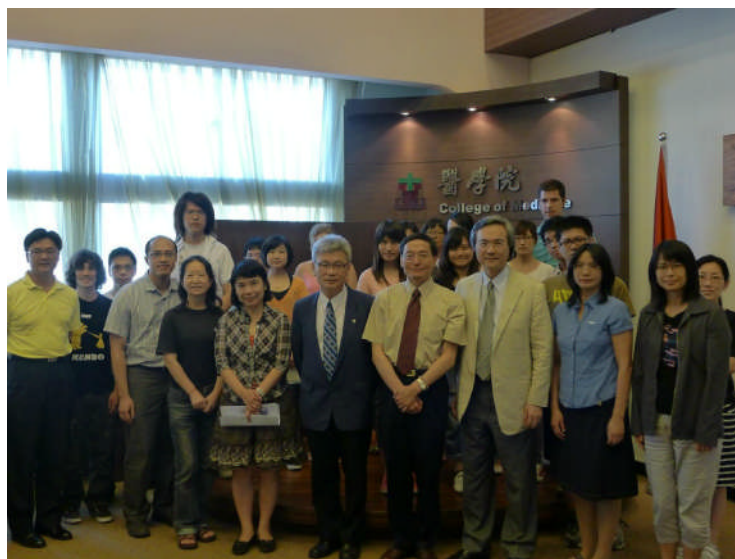
圖說：當日參加講座之師生合影。