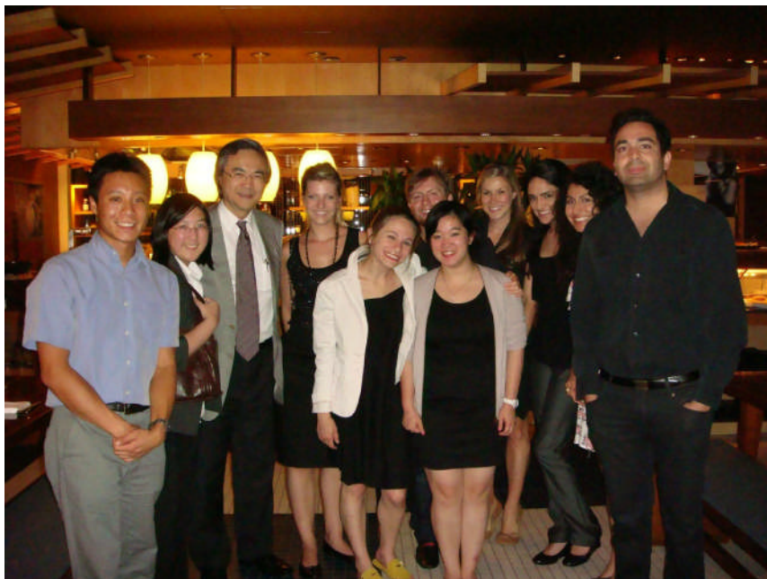
圖說：曾院長與南加大交換生合影。

醫學院曾院長應邀於7月13日向交換生演講台灣之醫學教育。7月14日晚間由曾院長邀請南加大交換生餐敘。