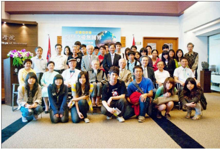
圖五：全體師生大合照。