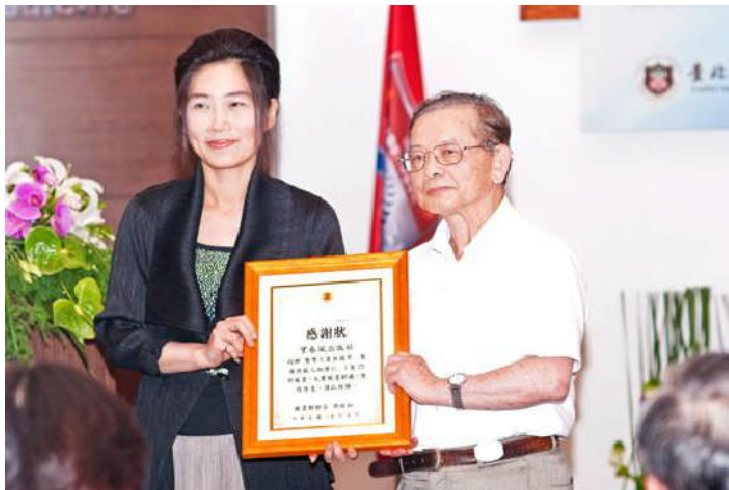
圖四：圖書館接受贈書，由館長回贈感謝狀。