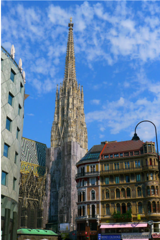
（維也納市中心史帝芬大教堂）

這幾年爲了傳承醫學知識及技能，醫學院在曾院長領導下，投注很多時間在醫學教育領域，北醫大醫學院醫學教育方針也由醫學院團隊共同討論、安排、制定，期待每年都能啓發年輕優秀的醫師，不爲名也