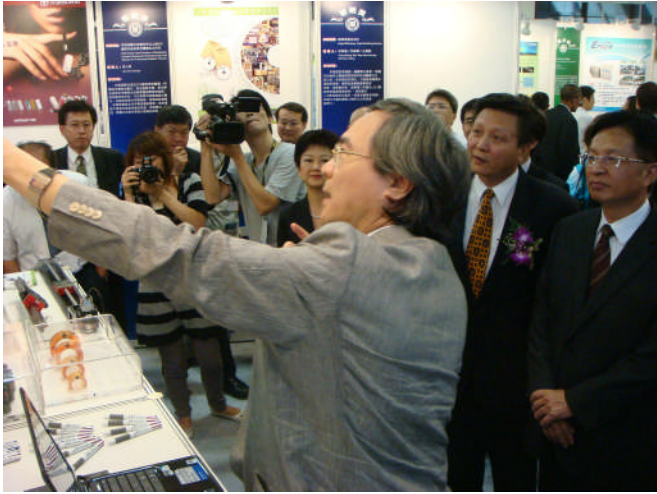
圖四：曾院長為經濟部施顏祥部長與現在來賓介紹本次的得獎作品