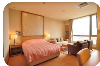
■ 溫馨舒適的調養空間。