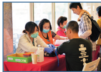
■ 雙和醫院安排肝癌檢測服務，民眾紛紛挽袖參加

守護民眾健康。今年父親節，院方特別針對男性朋友最常見的肝病與心血管疾病，規劃健康篩檢與義診活動，獻給爸爸們最貼心的父親節禮物。