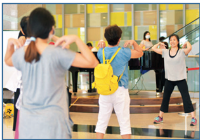
■ 有氧老師帶領大家一起運動甩肉。

爸爸是全家的靠山，終日為家庭奔波忙碌，難免疏忽了自己的健康。尤其近年來，心血管及肝臟疾病一直高居臺灣男性的兩大健康殺手！雙和醫院關心爸爸們的健康，特於8月6日上午舉辦「我愛爸爸-護心肝」健康篩檢活動，提供民眾免費的健康篩檢，並有專業醫師現場開講，傳授民眾心血管疾病與肝病的防治之道，活動吸引數百位民眾前來參加。