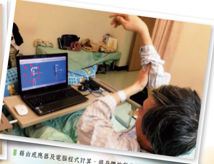
■ 藉由感應器及電腦程式計算，將身體的動作數位化。