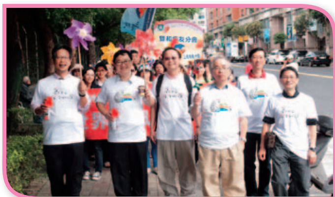
■ 由本院林副院長等人帶領踩街活動

與世界中風日同步，本院與台灣腦中風病友協會、腦中風學會等團體合作，25日於中和823公園舉辦台灣世界中風日活動。各地病友團體聚集，以踩街遊行的方式宣導「預防中風全壘打」的觀念，期盼共同打擊這個威脅國人健康的重要敵人。