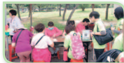
■ 現場設有多項活動攤位