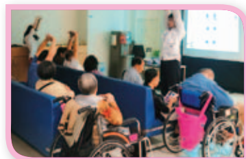
由復健部進行團體衛教