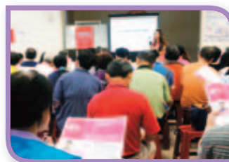
腎臟保健講座讓民眾長知識

腎臟是個多功能且忙碌的器官，腎臟正常運作才能使身體各部份的器官得到平衡運行，當腎臟受到傷害而無法運作時，身體其它器官都會連帶受到影響，腎臟的健康足以決定個人的生活品質。