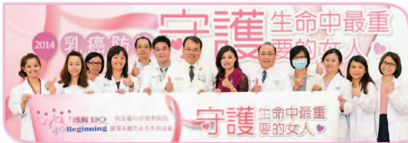
■ 本院乳癌團隊全體合照

配合國際乳癌防治月，本院10月於醫院大廳以大型粉紅背板，提醒民眾「守護生命中最重要的人」，且舉辦2場宣導活動，盼喚起民眾對乳癌防治的認知，早期發現、早期治療，以提高乳癌的治療預後。