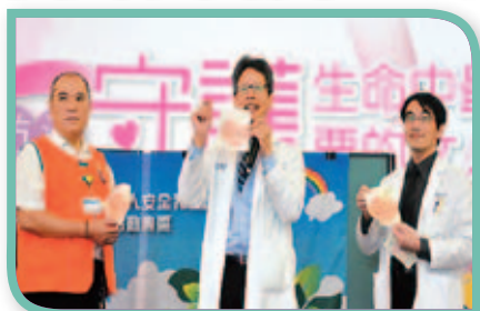
病人安全週啟動儀式

提供病人安全的照護，除了有賴醫療團隊的努力外，病人的參與更扮演相當重要的角色。本院於10月舉辦「病人安全週」活動，提醒民眾「看病防跌，人人有責」。