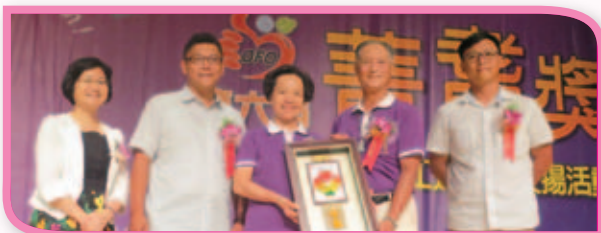
夫妻倆與兒子上台受獎

笑容滿面、親切熱心一直是來院民眾對本院志工的深刻印象，在眾多志工當中，有著一對羨煞旁人的夫妻志工，工作人員及志工談及他們總是讚不絕口、甚至稱讚他們為「代班小天使」。