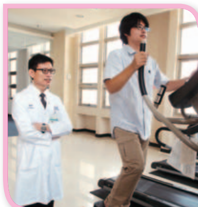
連續假日期間飲食仍應節制，且維持運動的頻率。

國民健康署委託本院的體重管理諮詢專線，每在年節前常會接到不少詢問與年節飲食相關的減重問題。體重管理諮詢專線特提出五大「節慶發胖症候群」檢視指標，供民眾參考。若遇到減重相關問題也可利用體重管理諮詢專線0800-367-100尋求專業協助。