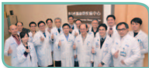
本院成立整合性腦血管疾病中心，提供全方位照護。

本院中風中心擁有完善的設備及優秀的團隊，是北區唯一通過國際認證（Clinical Care Program Certification CCPC）的中風醫療團隊，全年無休的為民眾提供最好的急性腦中風治療。我們可以給民眾最好的治療，但中風治療最重要的是時間，發生症狀時務必馬上就醫，「黃金三小時，拯救您一生」。