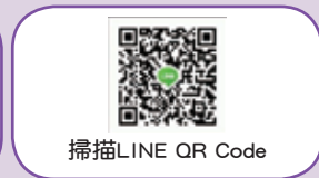
掃描LINE QR Code