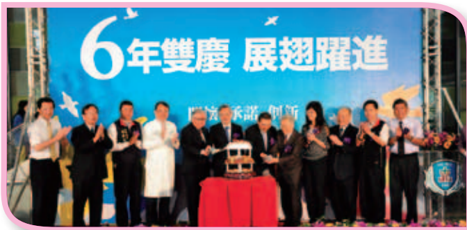
■ 本院歡慶6週年院慶。

本院7/1舉行6週年院慶及第二醫療大樓啟用儀式。第二醫療大樓全面啟用後，本院總床數達近1600床，成為新北市規模最大的醫院。第二醫療大樓部分樓層將投入長期慢性照護，將服務範圍從原本的急重症醫療，擴及長期慢性照顧，以滿足社會需求。