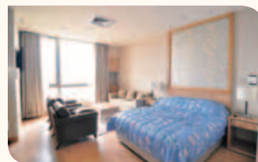
■ 產後護理之家提供服務。

本院成立以來，以提供急重症醫療為主，第二醫療大樓啟用後將擴及長期慢性照護領域，規劃4個樓層設立護理之家，預計可提供200多床的服務量。另設立產後護理之家，不論產婦從懷孕到生產後，或是小寶寶從在媽媽肚子裡到出生、長大，都可接受完整的醫療照護。