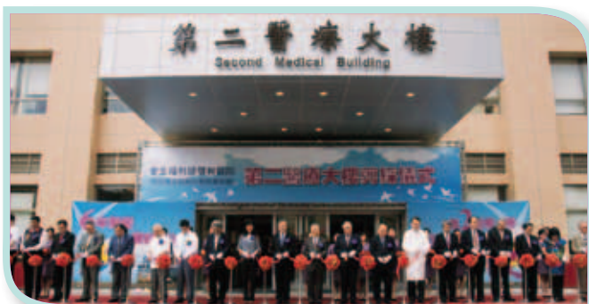
■ 第二醫療大樓正式剪綵啟用。

本院更負起社會責任，除提供石碇偏遠鄉鎮醫療服務，今年更進一步認購老茶農的茶葉，以期達到拋磚引玉之效，也傳達本院對這片土地最深的關懷。