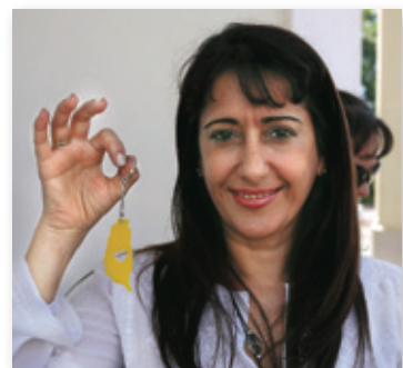
漫長又轉瞬間，我透過醫療讓世人看到台灣。

當所能分配的資源有限，病患的面目卻逐漸鮮明，面對的對象不再是某種疾病的「族群」，而是一個個有血有肉、有姓名的「個人」。我每每自問，我們何德何能可以決定「施予」醫療的對象？人的尊嚴和生命間的差距何在？這樣的問題我沒能找到滿意的答案，但思考這些問題的過程，卻是我從事國際醫療業務最大的收穫。