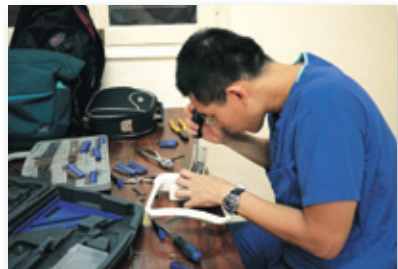
出門在外，一切都得自己動手修。

時我才逐漸發現醫療的昂貴。原來，在台灣我們習以為常，甚至有諸多抱怨的一切，其實都非「理所當然」。