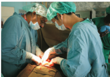
在有限的醫療資源下，傾全力救治患者。

歌聲飄揚中，酒館內許多國際組織人員隨之起舞，舞畢，一位葡萄牙男士對我們說：「台灣人很了不起，聖多美以前很多人得了瘧疾，現在很少了，這是台灣人製造的奇蹟！」。