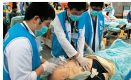
■ 病人被疏散到安全區域，並由醫師進行CPR。舉行消防演習，展現迅速移動病人的能力。

模擬的場景是警報器偵測到核磁共振室發生火警，中控室確認後發布火警通報，進行初級滅火，並聯絡消防隊前來支援。起火點旁邊的急診室展開疏散，迅速將病人移至安全地點，重症病人並由醫師現