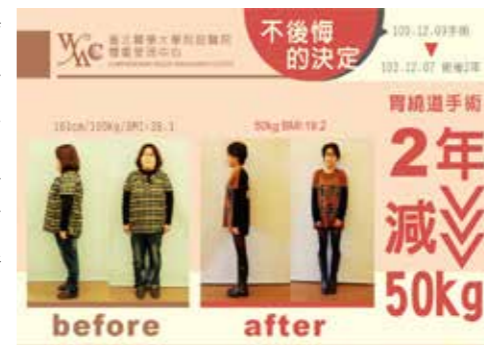
不後悔的決定 2年減50kg

因為肥胖導致有糖尿病及睡眠呼吸中止症，血糖一直控制不好，很怕會有很多後遺症，將來要麻煩家人照顧，加上睡眠呼吸中止症一直困擾著我，我不想戴機器睡覺，想要像正常人一覺到天亮，下定決心要瘦下來，2年前在北醫接受胃繞道手術，瘦下來身體變輕盈，可以追趕跑跳自由自在，感覺真好。成功瘦下來工作和人際關係變得更好，看事情的态度也變樂觀了!