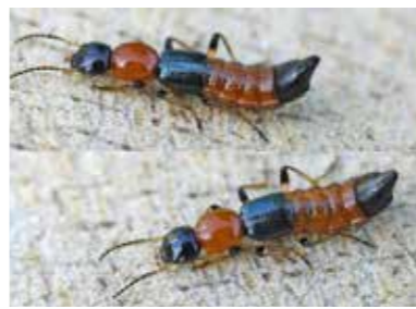
圖二 / 隱翅蟲(取自維基百科entomart)

隱翅蟲是一種昆蟲，為鞘翅目隱翅蟲科甲蟲的通稱，因為牠的翅膀很小，且藏匿在前翅之下不明顯因而得名，台灣地區最常見的是褐毒隱翅蟲，體長約0.5至一公分，身體為橘黃色，頭、胸及尾部為鐵灰色（圖二）。隱翅蟲常在夏天出沒，因此這類病患在夏天來門診求助的很多，而且此蟲喜歡在草地及樹林中活動，以郊區的居民較常見。此蟲有趨光習性，加上體型小，晚上可能會穿過紗窗飛入或爬入住戶中，進而造成皮膚疾病。