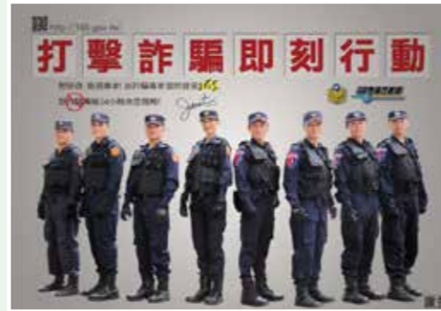
台北市政府警察局信義分局 六張犁派出所 關心您