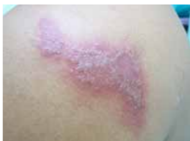
圖一 / 隱翅蟲所造成的皮膚炎

『醫師，好奇怪，睡覺前還好好的，一覺醒來的時候左肩膀好刺痛，皮膚紅腫又有點潰爛（圖一），我到底得了什麼怪病啊？是人家常說的皮蛇嗎？』這是一位年約四十的男性來到我的門診所求助的問題，經過視診以及病史的詢問，這位男性的皮膚問題並不是什麼可怕的怪病，而是所謂的『隱翅蟲皮膚炎』。