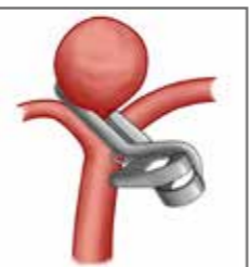
圖三、動脈瘤夾閉手術示意圖

一旦腦動脈瘤爆了，會發生許多後續的併發症，比如說動脈瘤再次爆裂、血管痙攣收縮、腦積水、感染、認知功能失調等等。如果腦動脈瘤再次爆裂了，那麼患者的死亡率會大大增加，而且病情的預後更差。所以在治療時，其中第一個要務就是避免它再次爆裂。因此，神經外科專科醫師們的責任就像拆炸彈一樣，要把這個不定時炸彈移除。目前，移除這個炸彈的方法有兩個，一是開顱顯微手術夾閉動脈瘤（圖三）、二是經動脈導管以白金線圈栓塞動脈瘤（圖四）。當然，這兩種方式都有其使用的適當時機，與可能發生的手術風險，所以在施行前都需要醫病之間充分的溝通。