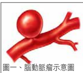
圖一、腦動脈瘤示意圖

甚麼是腦動脈瘤呢？雖然它的名字裡有一個「瘤」字，可是它並不是腫瘤，也就沒有良性或惡性的問題。因為人體內的動脈管壁在長期的血流衝擊下，因受到的壓力不平均，而在管壁薄弱處形成氣球狀的局部突出，這樣它便被稱作動脈『瘤』。身體裡各部位如腦部、胸部及腹部都可能發生，因為此時在腦袋裡發生了，所以叫做『腦動脈瘤』（圖一）。它就像顆不定時炸彈，平時完全感受不到它的存在，但只要一爆破就可能難以收拾，並且可置人於死。