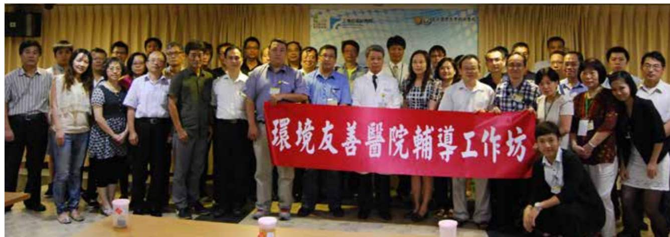
2014「環境友善醫院輔導工作坊」講座活動圓滿結束