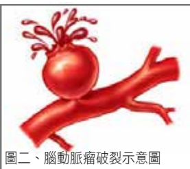
圖二、腦動脈瘤破裂示意圖

像是吹汽球一樣，氣球的壁越來越薄，如果受不了衝擊的壓力，就破掉了。因為腦內的動脈主要的分佈位置在腦的表面，而且有蜘蛛網膜這個腦組織包覆著。所以，腦動脈瘤破了（圖二），出血絕大多數都侷限在蜘蛛網膜的下面，因為這種破裂出血都沒有外力的因素，所以被稱為『自發性蛛網膜下腔出血』。腦動脈瘤破裂會造成極為嚴重的後果。一般來說，腦動脈瘤破裂後，15%患者被送到醫院之前就已經死亡。到醫院時仍活著的患者，即使經過積極治療，包括手術，仍有三分之一的患者會於一個月內死亡，三分之一的患者可能重殘（例如癱瘓或成為植物人），只有三分之一的患者能全身而退。