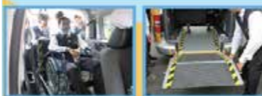
貼心贊助：太古汽車、皇冠大車隊 溫馨協辦：臺北醫學大學附設醫院