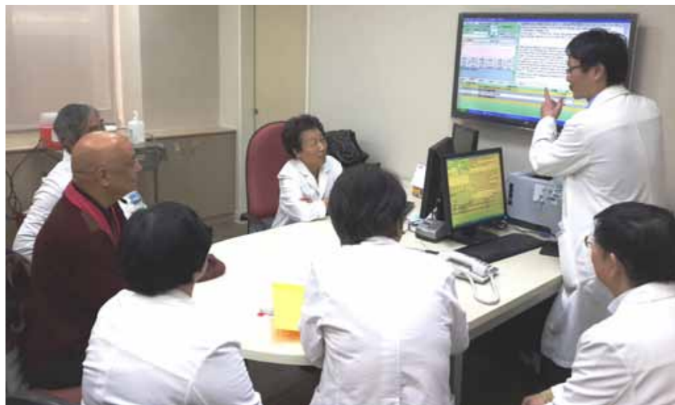
臺北癌症中心開設的「癌症特別門診」採團隊會診方式，給予病患完整的諮詢服務。

身體出現不適，被醫師宣告成為癌症患者的那一刻，心中的恐慌與疑慮是必然，怎麼可能？不是真的，再確定吧？此時此刻無不希望得到一個值得信任與接續的治療方向。北醫「臺北癌症中心」自費特別門診服務，透過顧問級醫師們的問診，為病患與家屬針對原始診斷與治療方式，提供詳實縝密的第二意見諮詢服務。