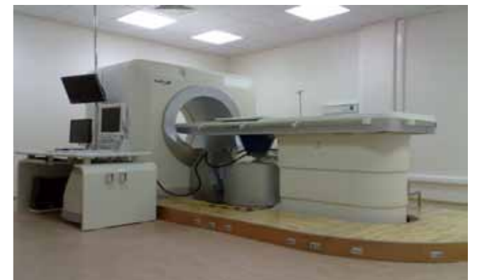
最新一代的高強度聚焦超音波腫瘤治療系統(HIFU)

本人在參訪期間也曾與中國重慶海扶創辦人王智彪博士交談，得知其海扶刀在中國已有100台以上安裝於各省三甲醫院使用，國際上也有30台安裝於歐洲及亞洲韓國，日本，香港使用。對於子宮肌瘤的治療可說是目前研究時間最長，效果最受肯定的技術。據統計其治療有效性達到98.38%，而併發症發生率為 0.12%，同時病人可以快速康復都是其明顯優勢。目前認為“海扶”高能量聚焦超音波治療儀應用最成熟的一種疾病就是子宮肌瘤的治療，未來也可以朝向所有類型軟組織的固體腫瘤，如肝腫瘤，腎腫瘤，乳腺腫瘤，骨腫瘤，胰臟腫瘤等等各種治療。