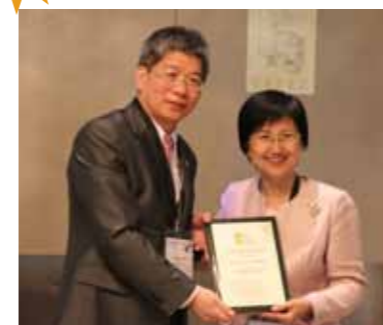
國民健康署署長邱淑媿與北醫附醫副院長朱子斌(左)頒獎合影

由國民健康署辦理的2013「國際低碳醫院團隊合作最佳案例獎」，頒獎典禮於2014年4月24日在西班牙巴塞隆納舉行，由國健署署長邱淑媿擔任頒獎人。此次活動全球共有33家醫院報名參賽，由國健署聘請專家組成評審小組進行評選，最後評定6家醫院獲獎包含臺北醫學大學附設醫院、新加坡邱德撥醫院(Khoo Teck Puat Hospital)、中國醫藥大學附設醫院、林口長庚醫院、大林慈濟醫院以及光田綜合醫院。