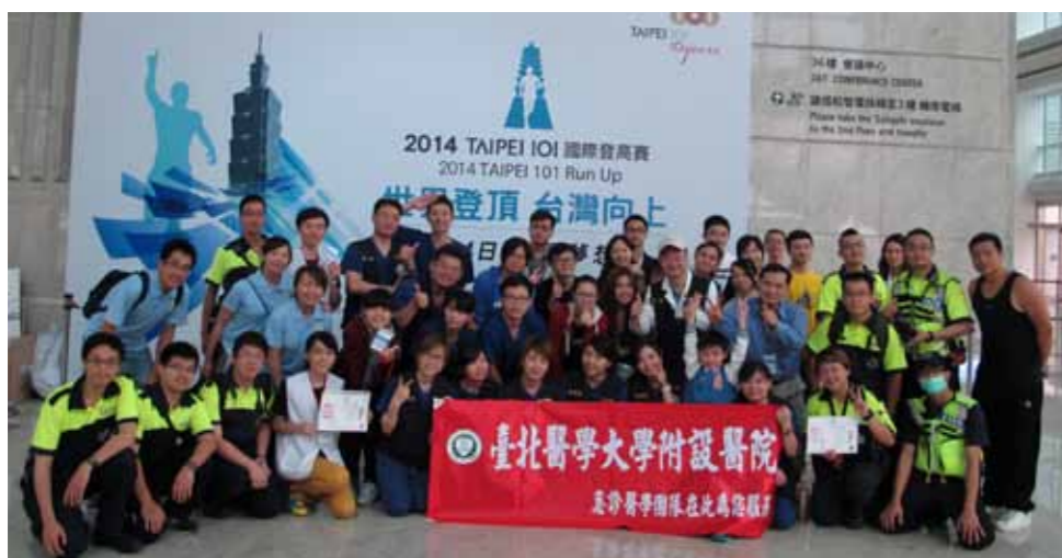
急診醫學部與台北市消防局一同守護參賽者的健康

年齡加總破250歲的5位來自臺北醫學大學附設醫院的乳癌病友媽媽們，於母親節前夕首度挑戰一年一度國際盛大體育賽事—台北101國際登高賽。