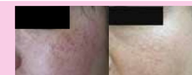
肉毒桿菌素注射 瘦小臉 治療前 治療後2個月

詳情請洽：(02)2737-2181分機8215.8285 地點：第三大樓12樓美容醫學中心