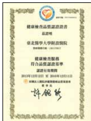
2013年健康檢查品質認證證書

能夠再次獲得醫策會「健康檢查品質認證」的保證，無疑是對北醫附醫健康管理中心的一大肯定。「好！還要更好！」，北醫附醫健康管理中心將秉持以「受檢者為中心」的服務理念，不斷提升品質，呈現給受檢者更安心、專業、舒適的服務，成為令民眾信賴、放心的首選健檢中心。