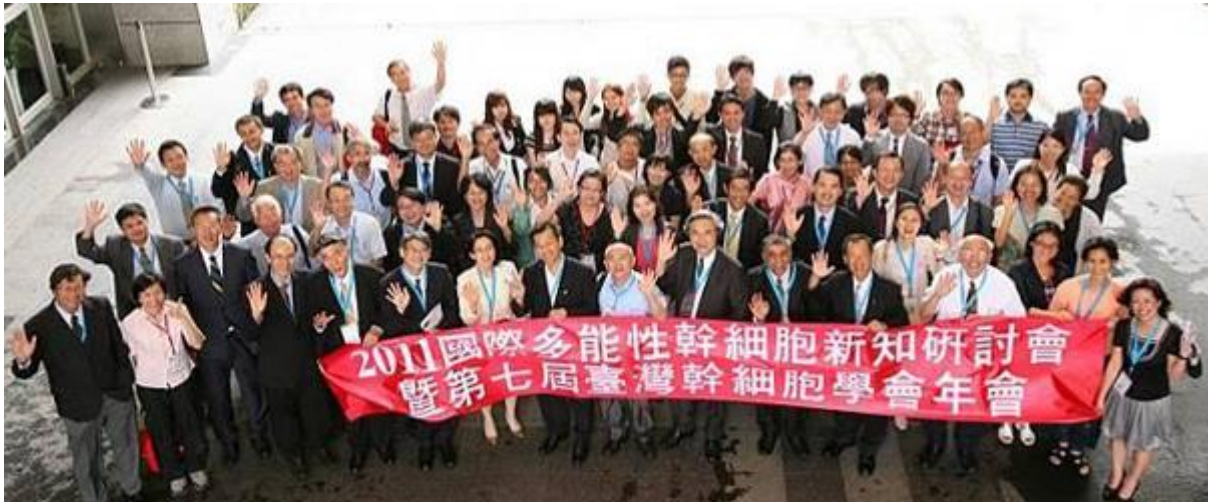
【圖：與會中外貴賓全體大合照】

除了上述學術議程的發表以及大會社交聯誼活動外，本次大會會場也設有攤位展示區以及論文海報發表區；大會更是由眾多自由投稿的稿件中遴選出 66 篇參與海報發表以及傑出論文獎比賽，在經由國內外評審審慎評核後挑選出 6 篇得獎作品，同時也在大會閉幕式頒發獎狀以及獎學金。此次醫學會議，充分展現台灣現在於幹細胞研究水準及技術之成就，有助於國際關係建立，長期實質助益極大。（文醫學院）